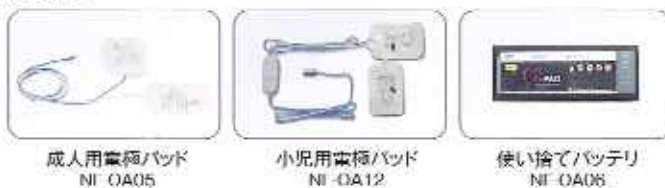
成人用電極パッド NF-0A05